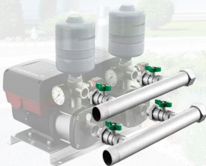
Комплект всасывающих/напорных труб для CMBE TWIN